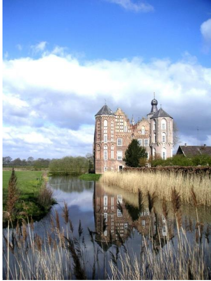
Strijp, Croy en Hoge Akkers