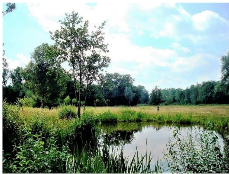
De Aarlese Beemden